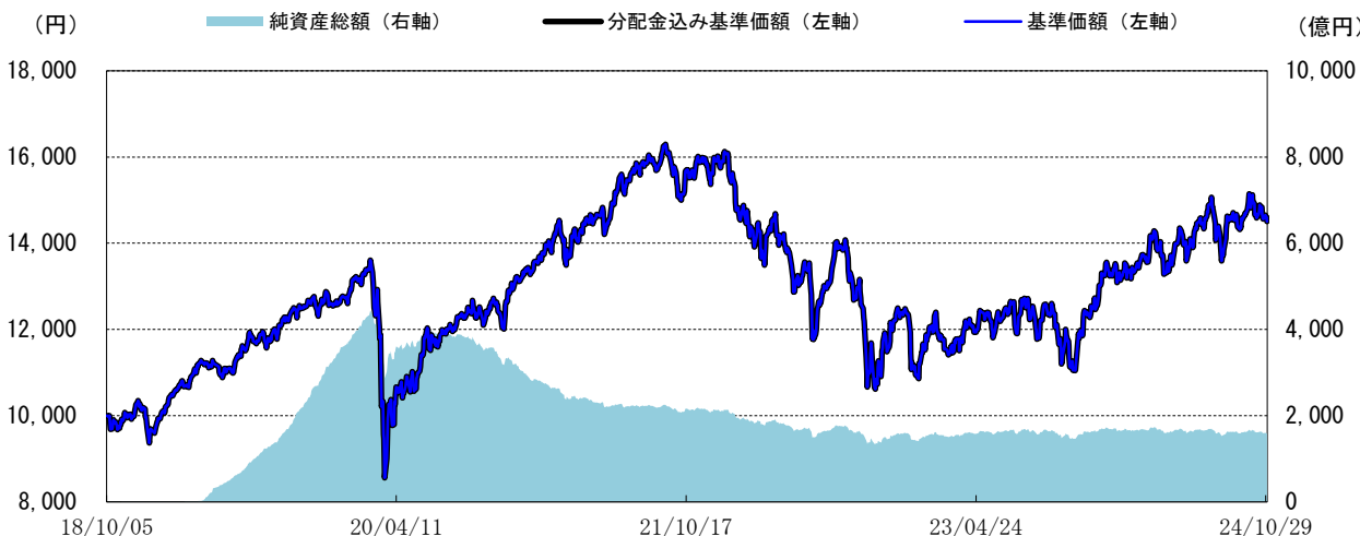
＜基準価額の推移グラフ＞

※分配金込み基準価額は、当ファンドに分配金実績があった場合に、当該分配金（税引前）を再投資したものと計算した理論上のものである点にご留意ください。 ※基準価額は、信託報酬（後述の「手数料等の概要」参照）控除後の値です。